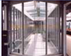
na de behandeling