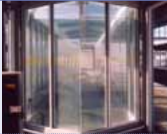
voor de behandeling